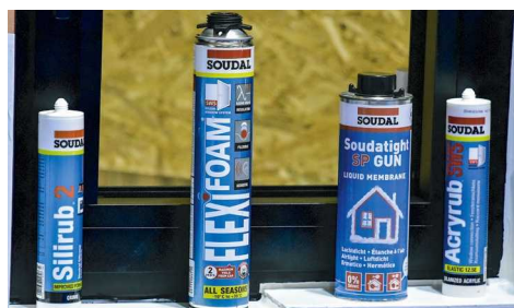
O Soudal Window System é exclusivo da Soudal e apresenta a melhor solução para cada tipo de janela

formação de bolores e fungos, destruição do estuque e tintas interiores, correntes de ar por deficiente estanquidade na ligação janela-parede, mais ruído que o expectável e maior necessidade de aquecimento ou arrefecimento para manter a temperatura interior na zona de conforto.