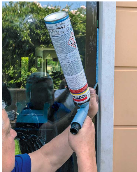
Os sistemas da Soudal asseguram que a zona de ligação janela-parede também seja eficiente

O Soudal Window System é um sistema exclusivo da Soudal que aborda a janela propriamente dita e a sua área envolvente como um todo, apresentando a melhor solução para cada tipo de janela e instalação e visa sobretudo garantir a eficiência máxima da janela desde que corretamente instalada. De facto, pouco serve ter uma janela eficiente se depois esta não é corretamente instalada ou seja, é necessário garantir que a zona de ligação janela-parede também seja eficiente, quer do ponto de vista térmico, acústico e de estanquidade ao ar e à água. Se tal não acontecer, as reclamações dos clientes são inevitáveis: condensações e